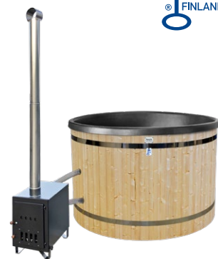
Les modèles de poêles et de conduits peuvent varier.